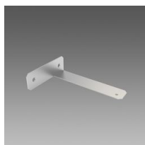
978 Étrier mural