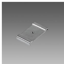
6036 Raccord universel