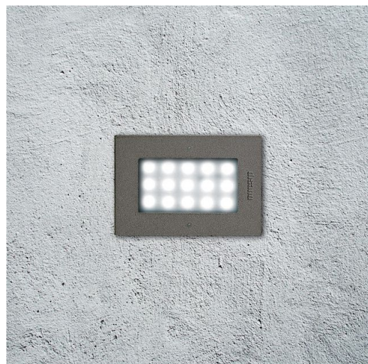
1673 Starled - rettangolare 230V