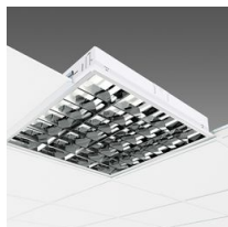
873 Comfort LED - UGR<19