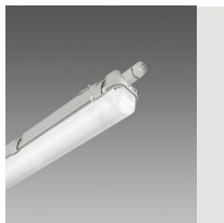
927 Echo - mono-émission LED - DÉTECTEUR DE PRÉSENCE