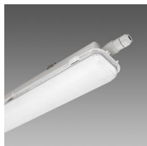
965 Hydro ICE-HT - high-low temperature