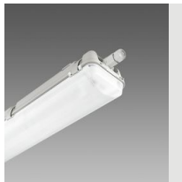
927 Echo - bi-émission LED - DÉTECTEUR DE PRÉSENCE