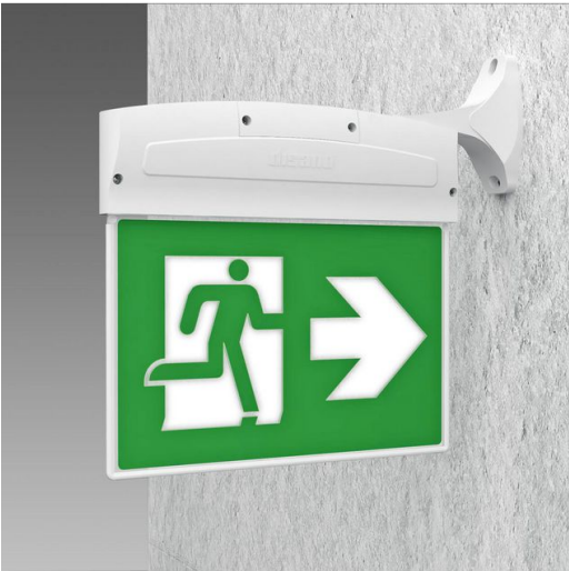
620 Safety Flag LED