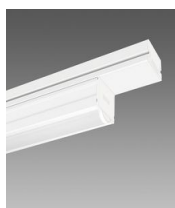
6605 Techno System - diffusore semisferico diffondente - CRI 90