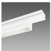
6613 Techno System HE - bi-asimmetrico 25° - CRI 80