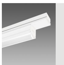
6616 Techno System HE - diffusore semisferico diffondente - CRI 80