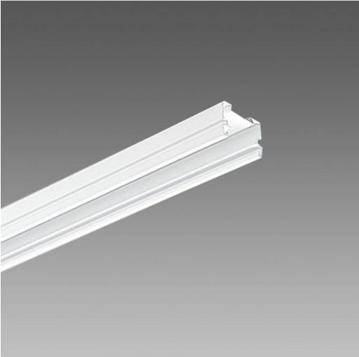
6000 Rapid System - Canale civile elettrificato