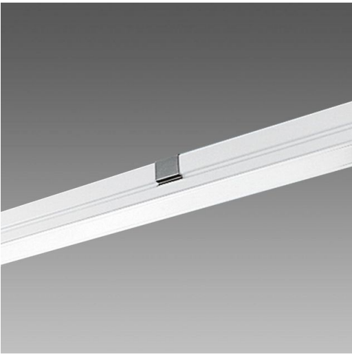
6051 Attacco plafone-sospensione