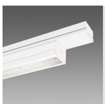
6613 Techno System HE - bi-asimmetrico 25° - CRI 80