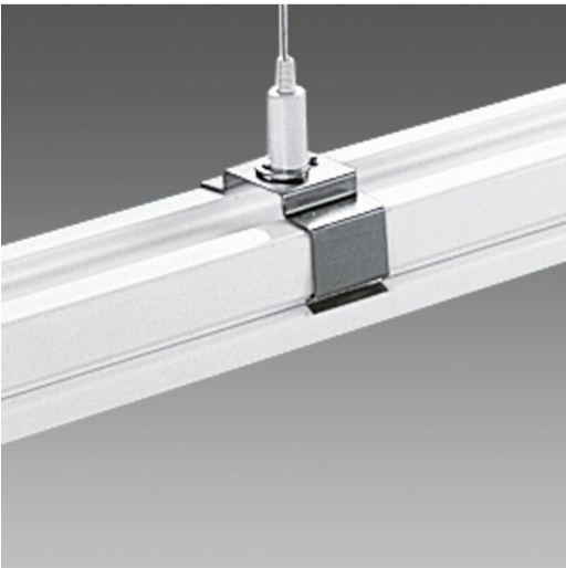
6053 Sospensione per cavo