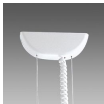
2608 Sospensione elettrificata