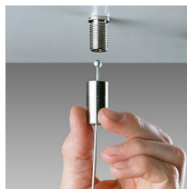
2518 sospensione semplice