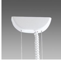
2608 Sospensione elettrificata