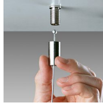
2518 sospensione semplice