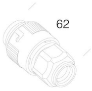
372 Presa per innesto rapido