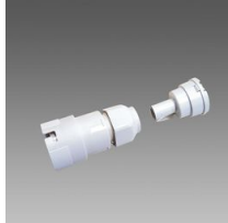
370 Innesto per tubo diam.20