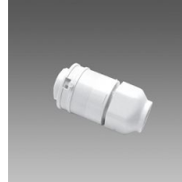
371 Spina per innesto rapido