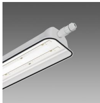
983 Forma LED - senza ganci per industria alimentare