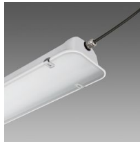
995 Forma LED - con vetro acidato