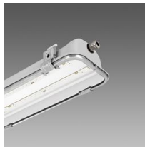
988 Forma LED HT - High temperature