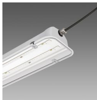
997 Forma LED - con diffusore in policarbonato