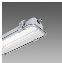
993 Forma ATEX - con vetro trasparente