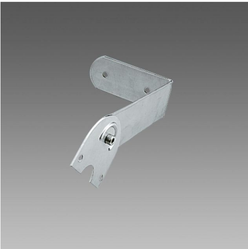
996 Staffa orientabile