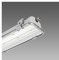
988 Forma LED HT - High temperature