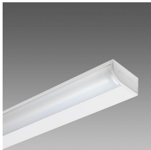
420 Rigo - LED