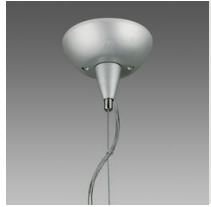
Sospensione elettrificata 3-5 poli