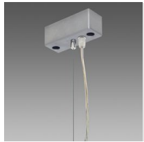
Sospensione elettrificata Q