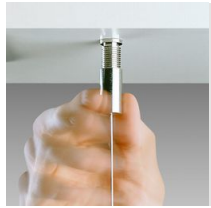
Sospensione semplice acciaio