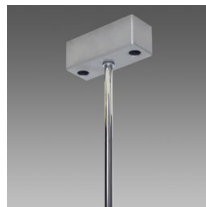
Sospensione semplice con tiges Q