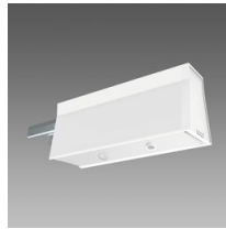
Sintesi Sensor - sensore di luminosità e/o presenza