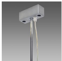
Sospensione elettrificata con tiges Q