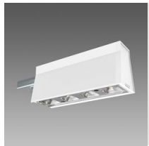
Sintesi Spot - UGR<22 - modulo luminoso