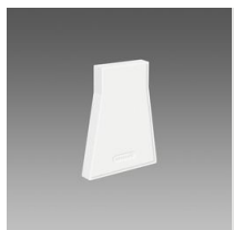
Testatina di chiusura 1 - Sintesi