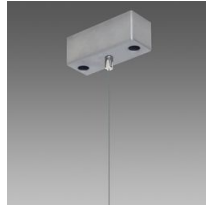
Sospensione semplice Q