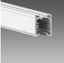
Omnitrack PLUS - 6 conduttori