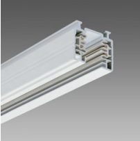
Omnitrack 3 accensioni