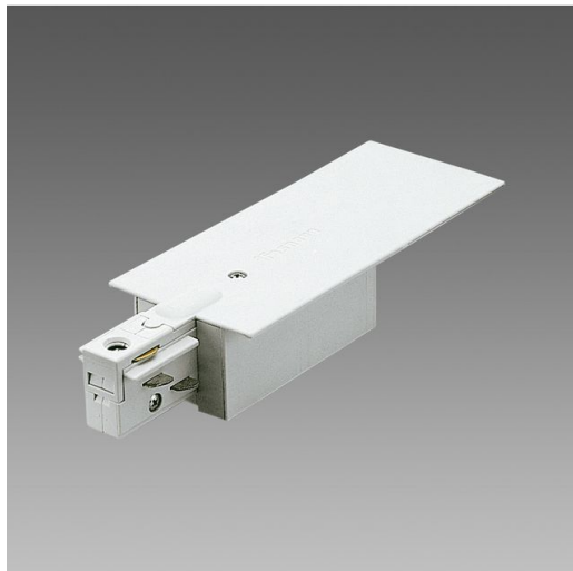
Alimentatore x binario incasso