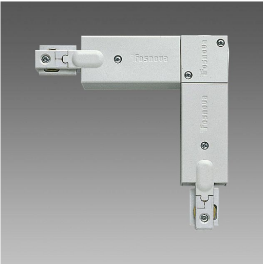
Elemento di giunzione a 'L' esterno