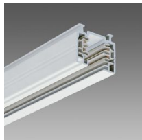
Omnitrack 3 accensioni