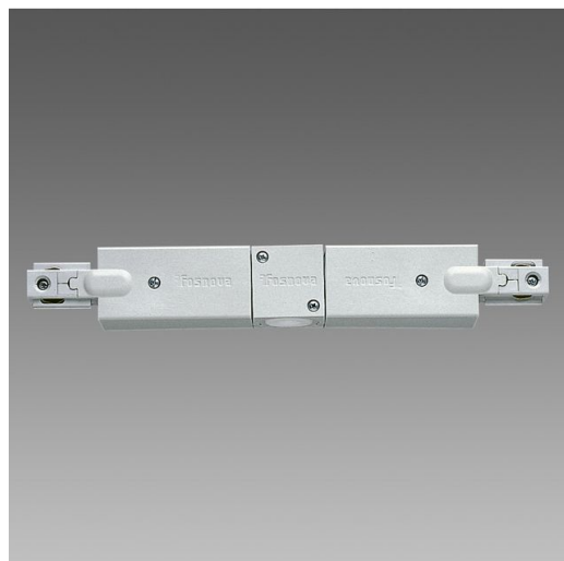
Elemento di giunzione lineare