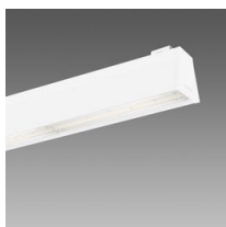
Sintesi System - plafone asimmetrica 25° - UGR<22