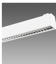
Sintesi System - plafone - ottica Dark - UGR<19