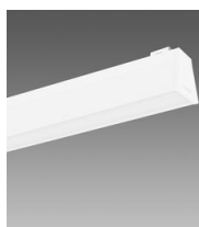
Sintesi System - plafone con schermo satinato - UGR<22