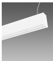
Sintesi System - a sospensione luce diretta indiretta - diffondente