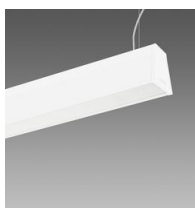
Sintesi System - a sospensione - con schermo UGR<19