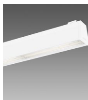
Sintesi System - plafone bi-asimmetrica 25° - UGR<22