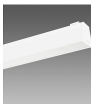
Sintesi System - plafone - con schermo UGR<19