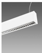
Sintesi System - a sospensione luce diretta indiretta - ottica Dark - UGR<19