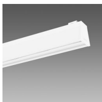
Sintesi System - plafone - diffondente