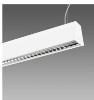
Sintesi System - a sospensione - ottica Dark - UGR<19