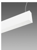
Sintesi System - a sospensione luce diretta indiretta - con schermo UGR<19