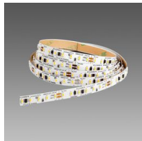
Strip - LED 24V - CRI>90