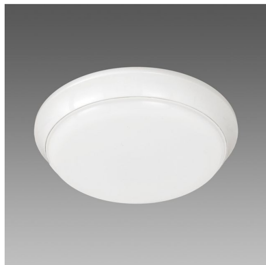
Tortuga - Sensore di presenza ON-OFF