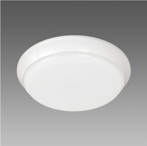
Tortuga Em SA - 220-240V