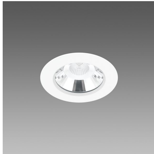
Jet 140 - IP65