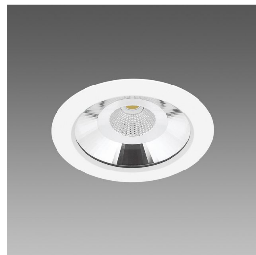
Jet 180 - IP65