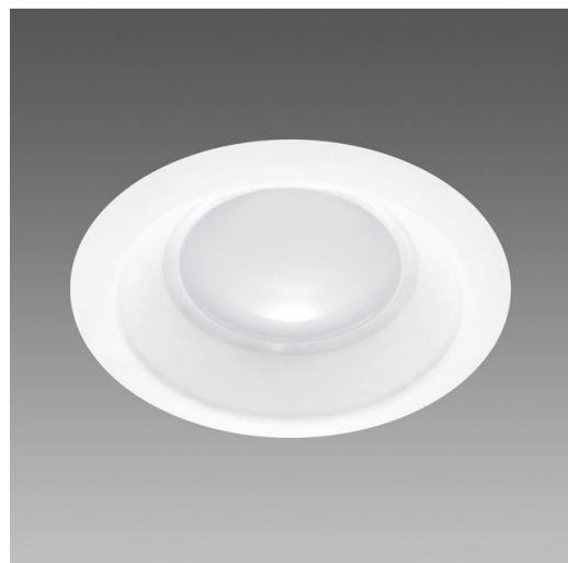
Speaker 3 B