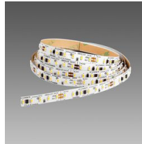
Strip - LED 24V - CRI>90