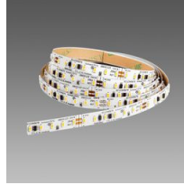
Strip - LED 24V - CRI>90