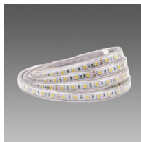
Strip - LED - IP65