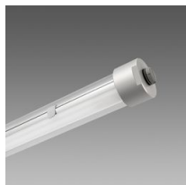
Micro Liset - Cilindrica Professional