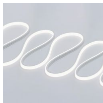
Strip SILICONE NEON - 24V - IP67 - CRI 80