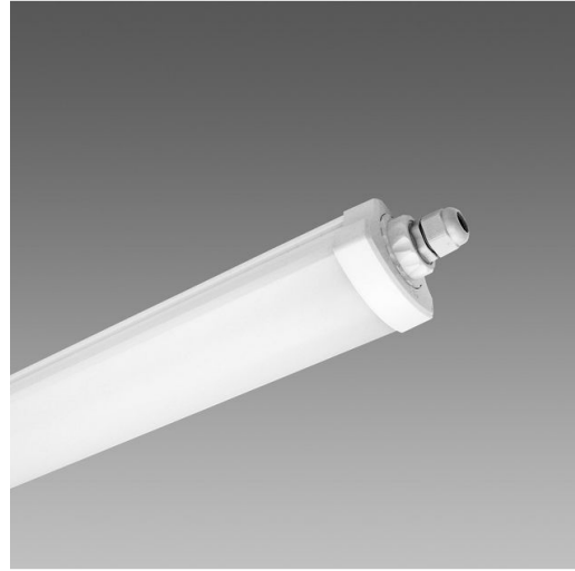
1784 Roda Basic