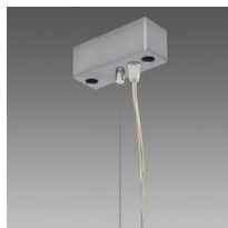
Sospensione elettrificata Q