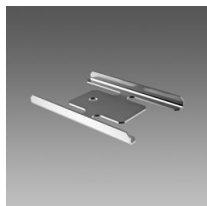
Staffa di giunzione - Liset 2.0