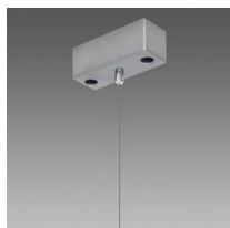
Sospensione semplice Q