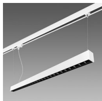
Attacco a sospensione per binario