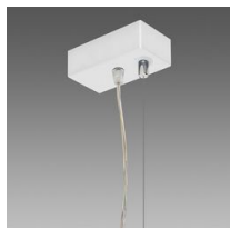
Sospensione elettrificata - 5 poli