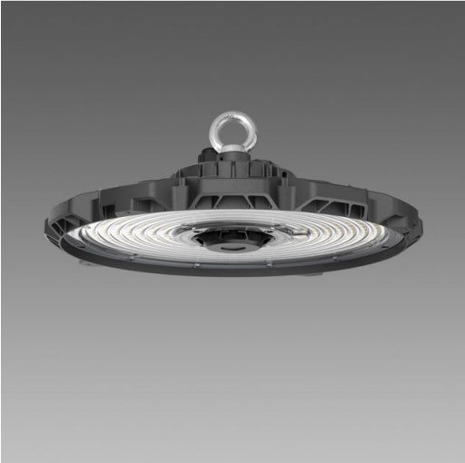
3700 Lucente 3.1