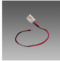
Connettore con cavo - Strip LED IP20

22028316-00 - Connettore per angolo - Strip LED IP20