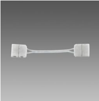
Connettore per angolo - Strip LED IP20