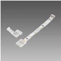
Connettore per fila continua - Strip LED IP20