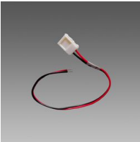
Connettore con cavo - Strip LED IP20