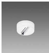
Acc. basetta per adattatore universale e DIMM 1/10V-DALI