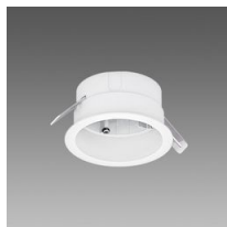
Acc. per incasso