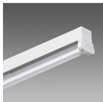
6402 Rapid system - monolampada LED