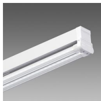
6502 Rapid system - bilampada LED