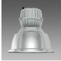
1172 Argon LED COB