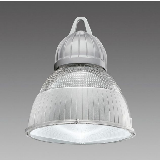
3116 Ghost LED - Diffusore micro satinato