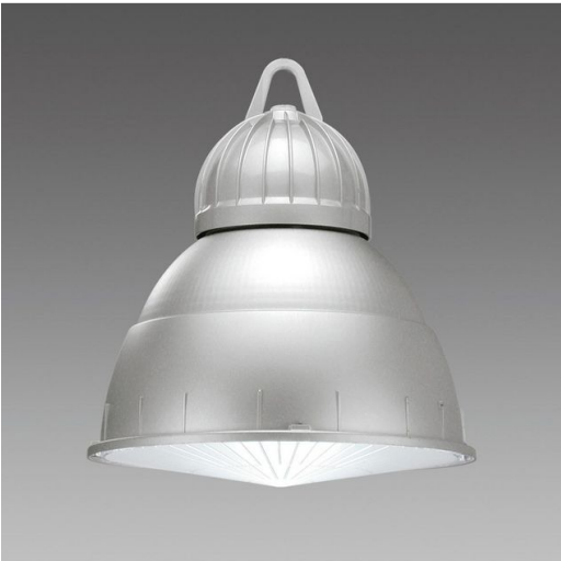
3117 Ghost LED - Diffusore verniciato