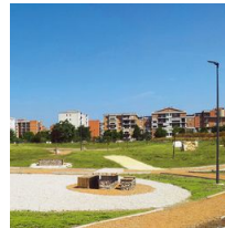
1493 Palo con base