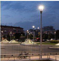
1477 Palo Urban - con base