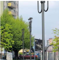
1491 Palo da interrare