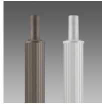
1508 Palo rigato ø 120 con base