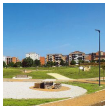
1493 Palo con base