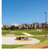
1493 Palo con base