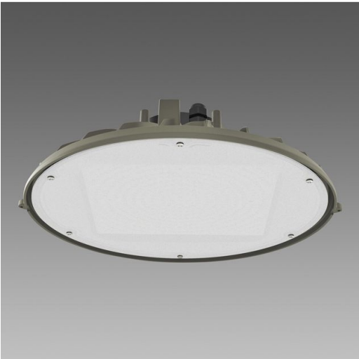
2881 Quark 3.7 - diffusore in policarbonato