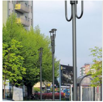
1491 Palo da interrare