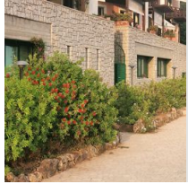
5 Palo in vetroresina