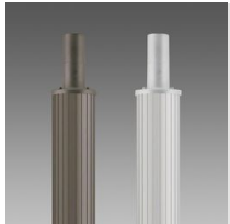
1508 Palo rigato \varnothing 120 con base